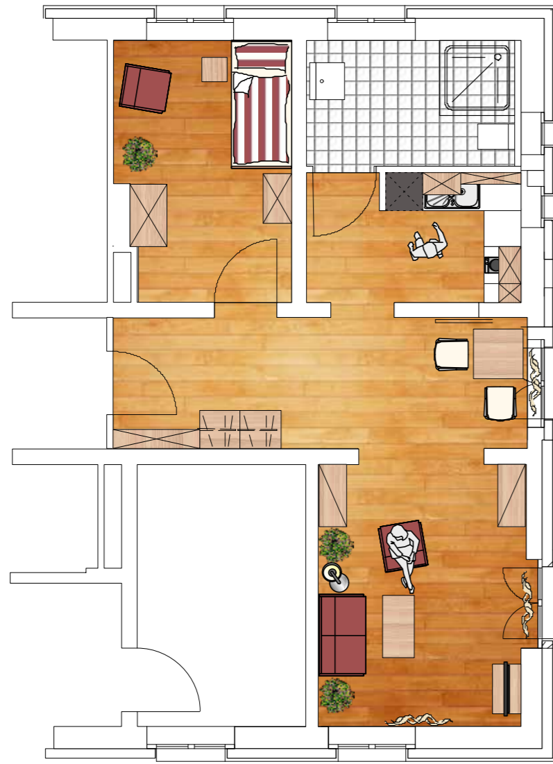
Beispiel: Wohnung 1 Größe 51 m 2