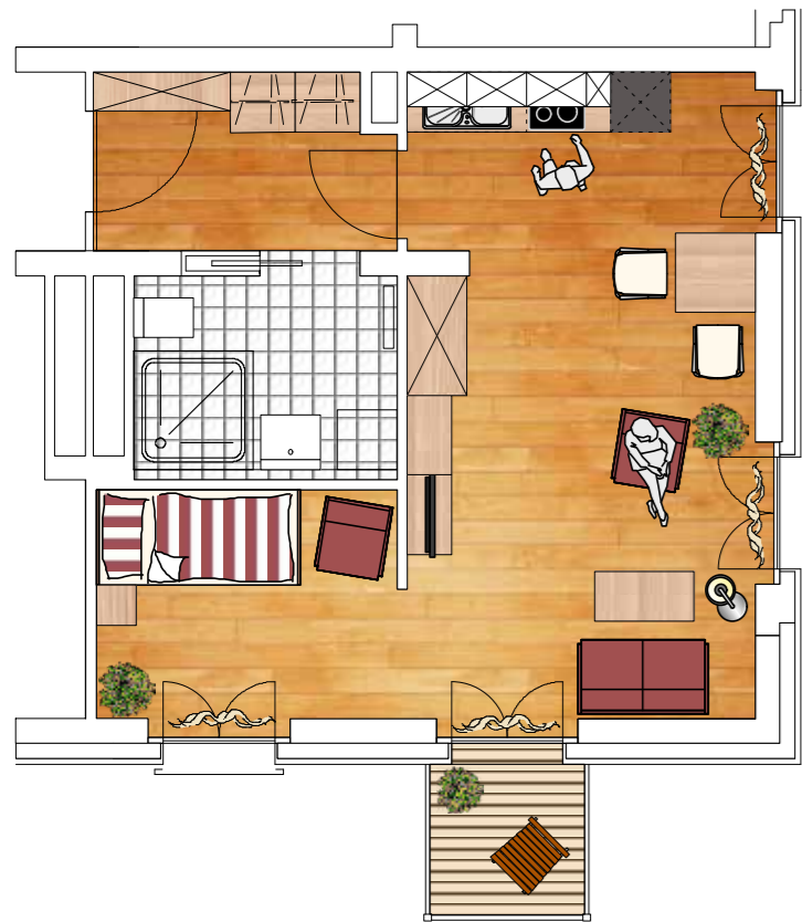
Beispiel: Wohnung 2 Größe 41 m 2 mit Balkon

Seniorenwohnen Maria Einsiedeln Eine Einrichtung der Stiftung der Cellitinnen zur hl. Maria